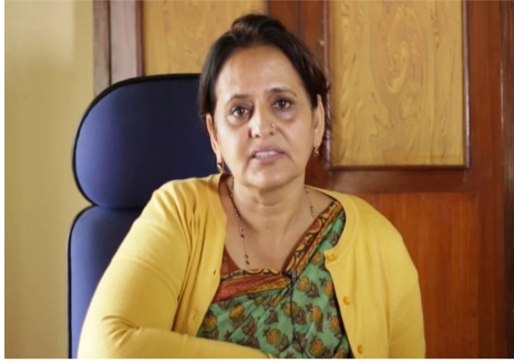
नेस संवाददाता काठमाडौं - नवनियुक्त प्रधानमन्त्री सुशीला कार्कीले