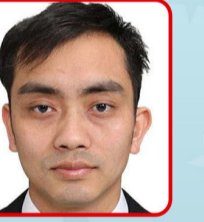
बुल ब. राजा मजार 'निशान' कोषाध्यक्ष